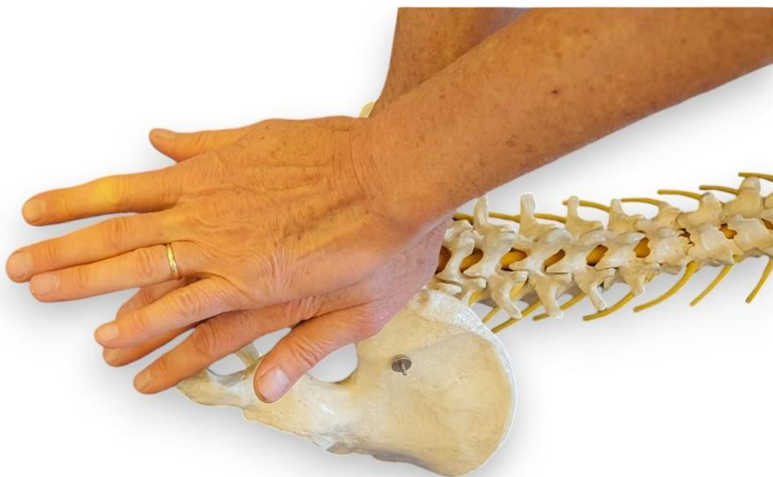
Ryc. 11. Chiropraktyk stoi na wysokości miednicy, twarzą skierowana do stóp klienta. Lokalizuje KBTG klienta, na których umieszcza opuszki palca wskazującego i środkowego dłoni zewnętrznej. Podstawą drugiej dłoni zjeżdża po w/w palcach, aby dłoń osiadła na kości krzyżowej. Dłoń ułożoną na kości krzyżowej klienta pokrywa się drugą dłonią, która wskazywała KBTG klienta.